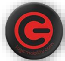
SOPORTE PARA TELÉFONO