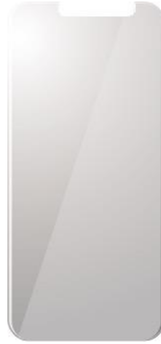
PROTECTOR DE PANTALLA