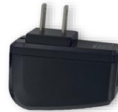
CARGADOR DE PARED