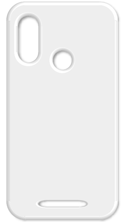
ESTUCHE DE SILICONA