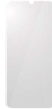
PROTECTOR DE PANTALLA