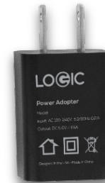
CARGADOR DE PARED